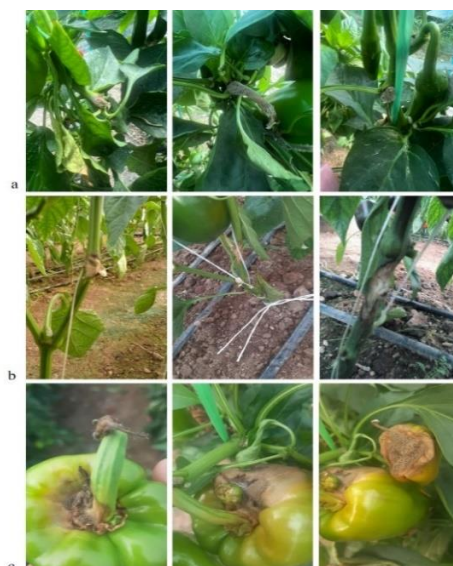
شکل ۱. علائم بیماری کپک خاکستری فلفل روی گل و محل زخم ناشی از برداشت میوه (a)، روی ساقه بصورت زخم و شانکر (b) روی میوه بصورت پوسیدگی (c).

Figure 1. Grey mold disease symptoms of pepper on flowers and wounded site of harvested fruit (a), lesion and stem cankers (b), fruit rot (c).