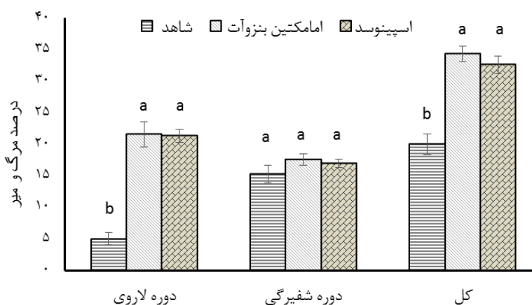
شکل ۲- اثر دو برابر غلظت توصیه شده‌ی مزرعه‌ای حشره‌کش‌های امامکتین بنزوات و اسپینوسد روی درصد مرگ‌ومیر مراحل نابالغ بالتوری سبز. حروف متفاوت در هر ستون نشان دهنده‌ی اختلاف معنی‌دار است (F-LSD, P<0.05).