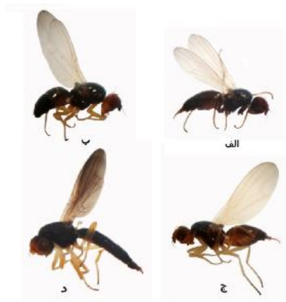
شکل 3- حشره کامل مگس‌های زنگ:

مگس هویج با پراکنش گسترده در جهان، یکی از آفات مهم کشاورزی در سبزی‌کاری‌ها محسوب شده و قابلیت ایجاد خسارت به هویج، کرفس و جعفری را دارد که با توجه به اهمیت اقتصادی این دوبال، تحقیقات زیادی به‌منظور کنترل این آفت روی محصولات کشاورزی خصوصاً هویج ( Daucus carota subsp. sativus ) صورت گرفته‌است (گورین و استادلر 1984، جود و بردن 1985، کولیر و فینچ 1990، رامرت 1993، دگین و همکاران 1999). بیشتر این تحقیقات مربوط به