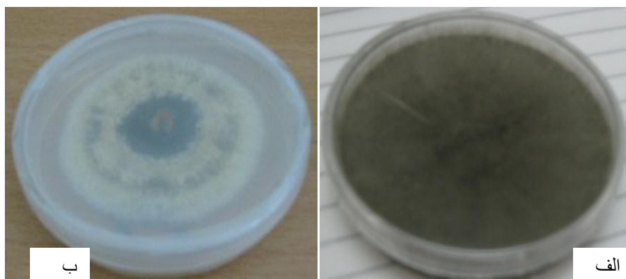
شکل ۲- تصویر کلنی جدایه‌های Metarhizium anisopliae استفاده شده در این تحقیق: کشت در محیط PDA و آنکوباسیون در ۲۸ درجه‌ی سانتیگراد به مدت ۱۰ روز. الف)، جدایه M1. ب)، جدایه A3.

و مؤثرتری بر روی شته‌ی سبزه‌لو هستند. در این مطالعه با توجه به نمودار رشد قطری جدایه‌ها مشاهده شد که درصد مرگ و میر شته‌ها با سرعت رشد کلنی