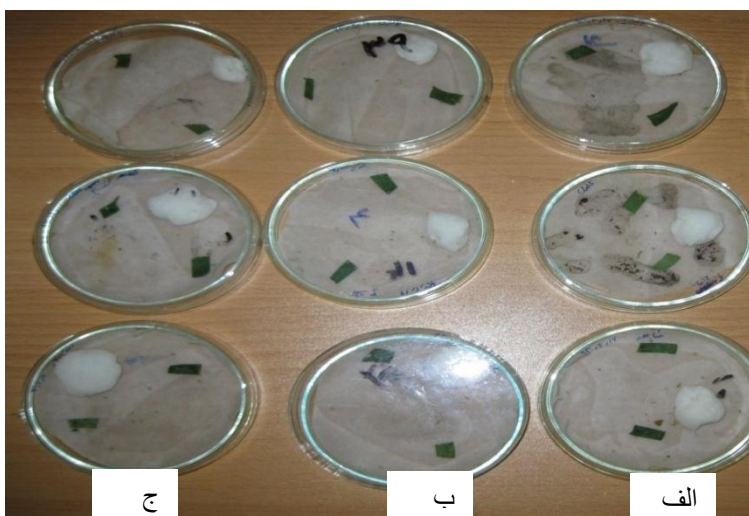
شکل ۱- تست زیست‌سنجی شته‌ی هلو: آزمایش در پلیت‌های شیشه‌ای ۱۸ سانتی متری با شرایط ۱۴:۱۰ ساعت تاریکی: روشنایی و دمای ۲۸ درجه‌ی سانتیگراد به مدت ۹ روز. الف) جدایه A3 با سه تکرار، ب) جدایه M1 با سه تکرار، ج) شاهد با سه تکرار.

برگ‌ها و نگهداری شته‌ها قرار داده شد. پلیت‌های آماده شده در دمای ۲۱ درجه‌ی سانتیگراد و شرایط ۱۴:۱۰ ساعت تاریکی: روشنایی به مدت ۹ روز تیمار شدند (شکل ۱). مرگ و میر شته‌های اسپری شده روزانه مورد بررسی قرار گرفت. شته‌هایی که قدرت تحرک نداشتند و رشد قارچها بر روی آنها مشخص بود، به عنوان شته