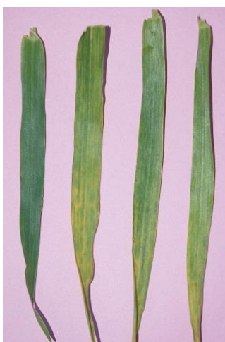
شکل ۱- نمونه اول از سمت چپ نمونه سالم و سایر نمونه‌ها، نمونه‌های آلوده مایه زنی شده با ویروس موزاییک رگه‌ای گندم در گلخانه.