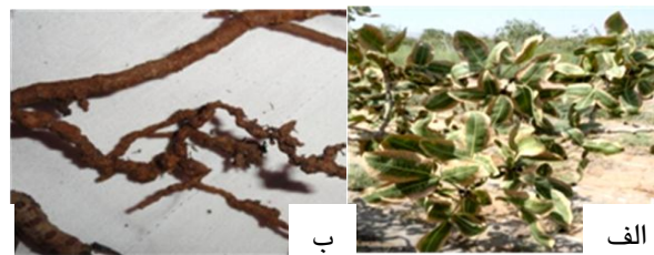
شکل ۱- الف: علائم نماتد مولد گره ریشه روی درختان آلوده پسته ب: ریشه‌های آلوده به نماتد. ج

از راهکارهای کنترل مؤثر باشد. چنین اطلاعاتی برای برنامه‌ریزی سامانه‌های کشت و به حداقل رساندن خسارت نماتد مفید خواهد بود. تحقیق حاضر در جهت نیل به این اهداف انجام گرفته است.