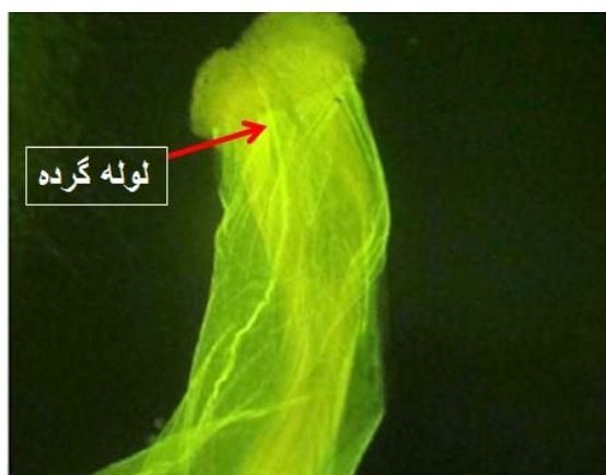
شکل ۴- رشد لوله گرده و سطح کلاله در تیمار شاهد تحت مطالعه با میکروسکوپ فلورسنت.