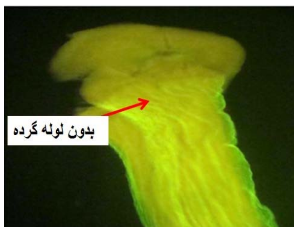
شکل ۳- رشد لوله‌گرده و سطح کلاله در تیمار قارچ‌کش بیم دو در هزار تحت مطالعه با میکروسکوپ فلورسنت.

در نتیجه‌گیری کلی از این آزمایش می‌توان اظهار داشت که تأثیر قارچ‌کش‌های انتخابی با غلظت‌های متفاوت، بر برمرفولوژی و آناتومی دانه‌های گرده و رشد لوله‌گرده متفاوت بود که با افزایش غلظت قارچ‌کش‌های انتخابی این تغییرات بیشتر بوقوع پیوست. در تیمار با قارچ‌کش سومی ایت یک در هزار دانه‌های گرده دارای لوله‌گرده بلند کشیده و دانه‌گرده شفاف بود در حالی که در تیمار با قارچ‌کش کربوکسی‌تیرام دو در هزار، بیم (یک و دو در هزار)، دینوکاپ دو در هزار دانه‌های گرده تیره بوده و لوله‌گرده ضعیف و کوتاهی به دست آمد. بالاترین درصد تشکیل میوه با تیمار سومی ایت یک در هزار با میانگین ۲۷/۷۸ درصد و کمترین درصد تشکیل میوه با تیمار بیم یک و دو در هزار و دینوکاپ دو در هزار بدون تشکیل میوه در مقایسه با شاهد که ۳۸/۲۱ درصد بود به دست آمد. مصرف قارچ‌کش‌هایی مثل دینوکاپ با غلظت‌های یک و دو در هزار و کربوکسی‌تیرام دو در هزار در مشاهدات میکروسکوپی نشان داد که این قارچ‌کش‌ها باعث بدشکلی و دفورمه شدن مادگی و سوزش شدید سطح کلاله می‌گردد. به طوری که سطح کلاله کدر و سیاه گردیده بود. کاربرد قارچ‌کش در گل‌دهی و گرده‌افشانی می‌تواند به طور مستقیم